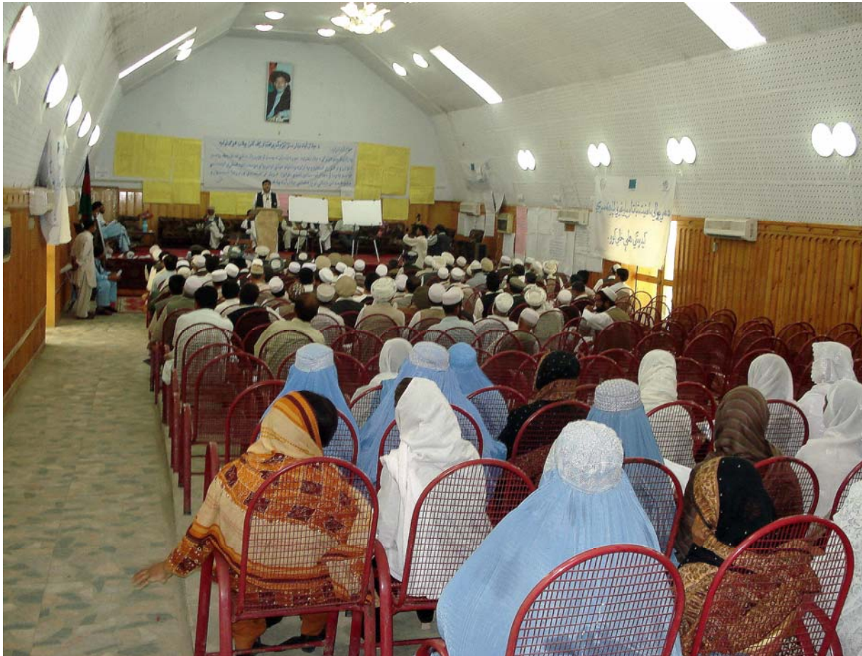
Workshop van UN-HABITAT met mannen én vrouwen 1

Een voorbeeld hiervan is de aanleg van drainagesystemen en het bestraten van buurtwegen. Mensen hoeven dan niet meer door de modder en hun stadswijk wordt hygiënischer. In bepaalde stadsdelen, meestal informeel gebouwde, krijgen bewoners van wijken subsidie als ze samenwerken en een zogenaamde Community Development Council oprichten. Dat zijn een soort wijkraden die democratisch worden gekozen en waarin de bewoners zelf kunnen beslissen wat er met het geld gebeurt. Men kan zelf kiezen of er een school wordt gebouwd of dat de straat wordt verhard. UN-HABITAT faciliteert met het democratisch houden van het proces, technische kennis over bijvoorbeeld de aanleg van afvoergoten en een beetje geld. De bewoners moeten zelf ook de helft betalen, vaak gebeurt dit in kind door bijvoorbeeld het werk te verrichten nadat UN-HABITAT de bouwmaterialen heeft gekocht.