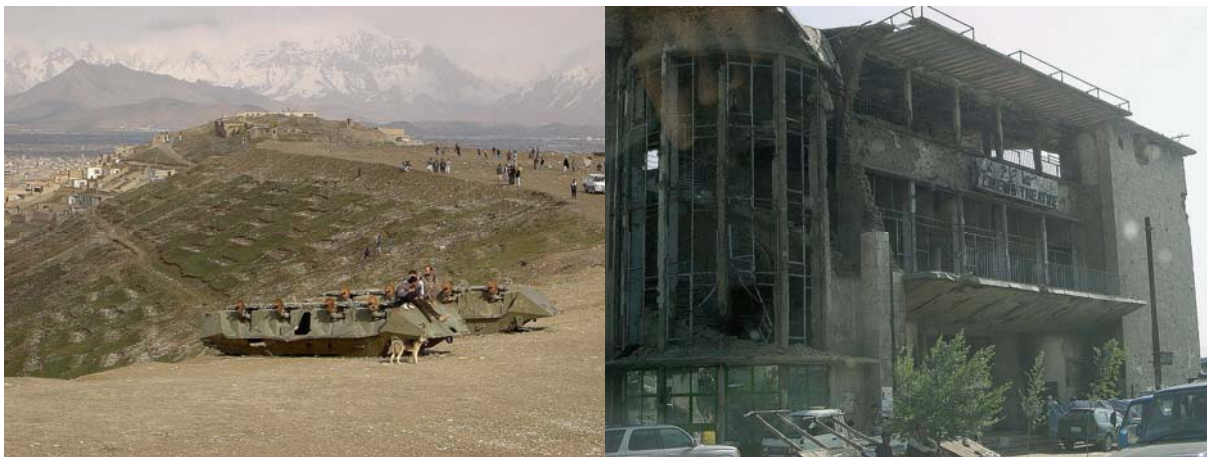
In de Afghaanse hoofdstad Kabul zijn de sporen van jaren oorlog nog aanwezig. 1

Andere steden in Afghanistan kampen met vergelijkbare problemen. Ook daar dromen de bewoners, politici en professionals van een betere stad: geasfalteerde wegen, goede huizen, stromend water en 24 uur per dag stroom bijvoorbeeld. Ze moeten wel, na 20 jaar oorlog is er zo veel verstoord dat dromen het enige middel lijkt om positief naar de toekomst te kijken, ook bij ruimtelijke planning. Behalve dat ruimtelijke planning dromen nodig heeft om überhaupt van de grond te komen in een (post) conflict situatie, kan het ook helpen dromen werkelijkheid te laten worden. In Afghaanse steden is tenslotte ook veel moois te vinden zoals prachtige moskeeën en eeuwenoude bazaars. Iedereen droomt van een betere toekomst waarin deze een plek hebben in een goed functionerende maatschappij.